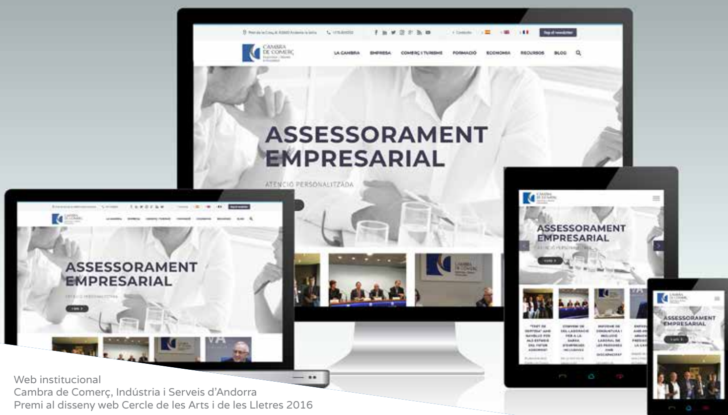
Web institucional Cambra de Comerç, Indústria i Serveis d'Andorra Premi al disseny web Cercle de les Arts i de les Lletres 2016

DISSENYEM, DESENVOLUPEM, POSICIONEM I DONEM SUPORT PER PÀGINES WEB DE TOT TIPUS